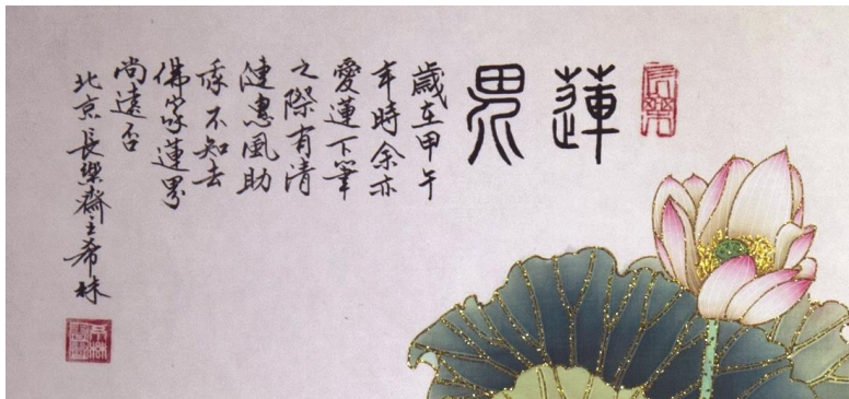
鄭希林的書法蓮筆娟麗清秀 Zheng Xi-lin's Calligraphy - comely and beautiful

Probity, honesty, honor and integrity all mean uprightness of character or action.