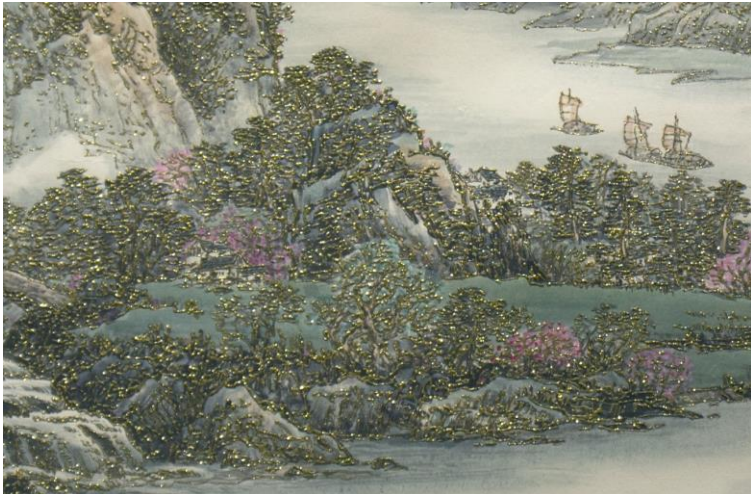
桃花源里人家 Living in peach blossom paradise

Beautiful landscaping, Stunning views and Glittering forest create a Peach Blossom Paradise.