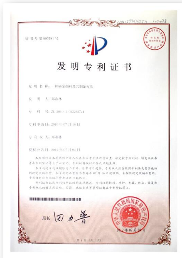
圖為發明專利證書 Figure for certificate of invention patent